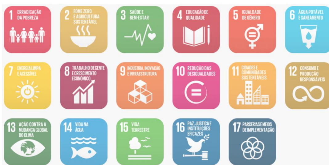
Figura 02: Objetivos de Desenvolvimento Sustentável

Em fortalecimento aos compromissos firmados pelo governo federal junto a ONU que fazem parte dos Objetivos de Desenvolvimento Sustentável – ODS, articulados através da agenda 2030, este projeto promove a utilização de estratégias para construção de edificações sustentáveis, como forma de garantir a sua resiliência e adaptabilidade em meio às mudanças climáticas. Sendo assim o mesmo foi desenvolvido com a utilização de sistemas construtivos capazes de contribuir para a preservação e conservação do meio ambiente, diminuindo o uso e o esgotamento dos recursos naturais, a produção de resíduos e o consumo de energia.